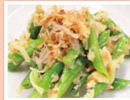
いんげんのフィリング和え